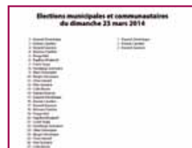
modèle de bulletin de vote

Pour la première fois, l'électeur procédera donc directement à l'élection des conseillers communautaires, soit au suffrage universel direct.